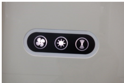
ファン、照明、異常表示スイッチ