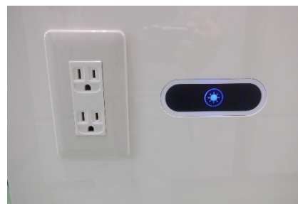
照明のみ点灯 ※OFF時は、消灯する